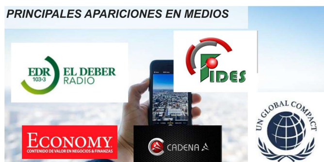
Foto 1: Medios de Comunicación que dieron cobertura a entrevistas al CFV/FSC Bolivia

A continuación se presenta un resumen ejecutivo del plan comunicacional Anexo 3