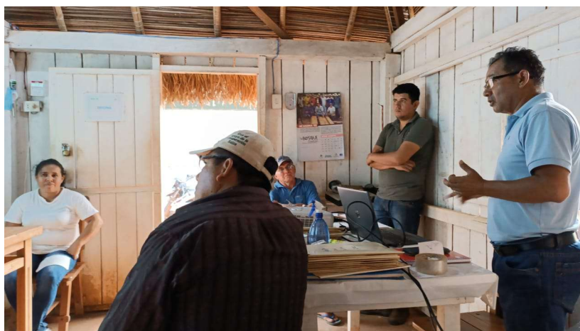
Foto 2: Explicación del proceso de certificación a la Directiva de la Asociación de Productores de Pulpa de Asaí de la Comunidad de Porvenir

Mediante la firma de un memorándum de entendimiento entre la Comunidad de Porvenir, el proyecto Probosque II del GIZ y el CFV/FSC Bolivia, en junio de 2022 se inicia la capacitación para certificación de productos no maderables en la Comunidad de Porvenir. La certificación contempla el manejo forestal para la cosecha del Asaí y cadena de custodia para el procesamiento y obtención de la pulpa.